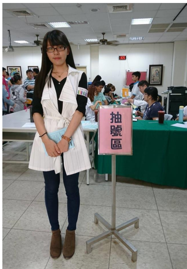
(擔任接待人員，左手臂上為當日的工作人員識別貼紙)