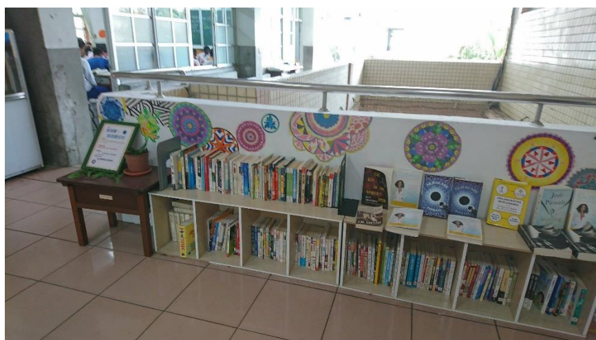
(教學大樓入口處的圖書館外環境)