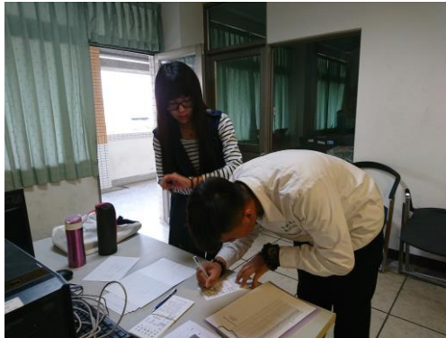
(6)協助教務處特教組資優班專題講座——魔術好好玩。