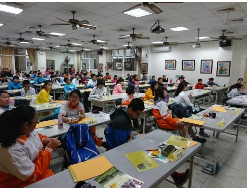
(7)協助教務處 106 學年度下學期教科書分發事宜。