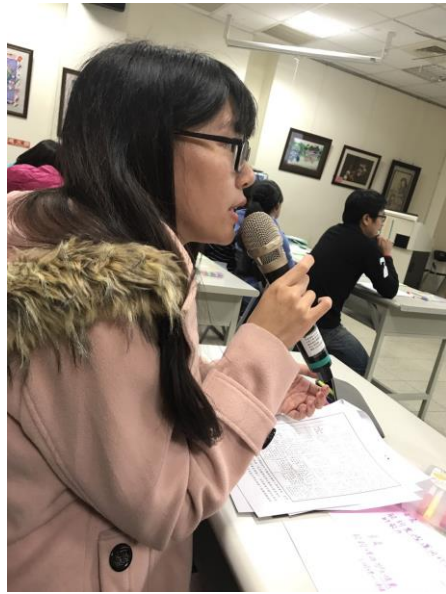
(研習時照片，有賴實習夥伴從旁協助拍攝)